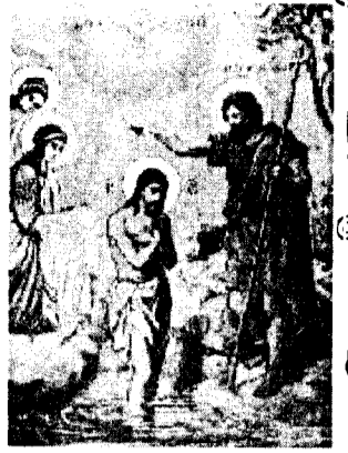
Крещение Иисуса Христа в реке Иордан

Зачем безгрешный Иисус пришел креститься? Ответ на этот вопрос мы находим у самого Иоанна Крестителя; "Я для того пришел крестить в воде, чтобы Он (Христос) явлен был Израилю," иными словами, чтобы при крещении стало известным, кто Он. До этого времени Иисус Христос жил в тиши Назарета, и знали Его только жители маленького города, как сына Марии и плотника Иосифа. Теперь же Христу исполнилось тридцать лет, и Он получал право, согласно еврейским законам, учить народ и называться "равви" - наставником. Настало время явить Себя народу, а народу - услышать свидетельство о Нем, как о давно ожидаемом Мессии. Это и свершалось теперь на берегу Иордана.