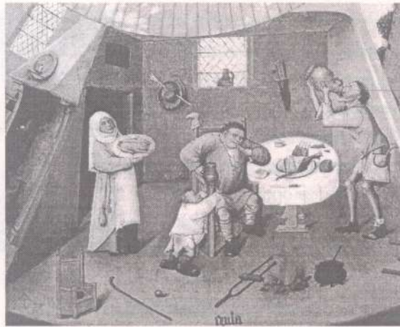
Босх. Страсть чревоугодия

Нередко чревоугодник, уставший от груза собственного тела, и от необходимости постоянно преодолевать как преграду размеры собственного живота, решает объявить войну бесу чревоугодия и уничтожить как врага собственный жир. Однако такой чревоугодник, севший на