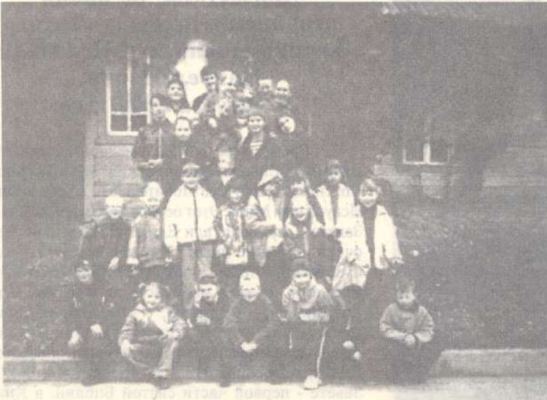
В музее Пушкина. Усадьба Маркучай