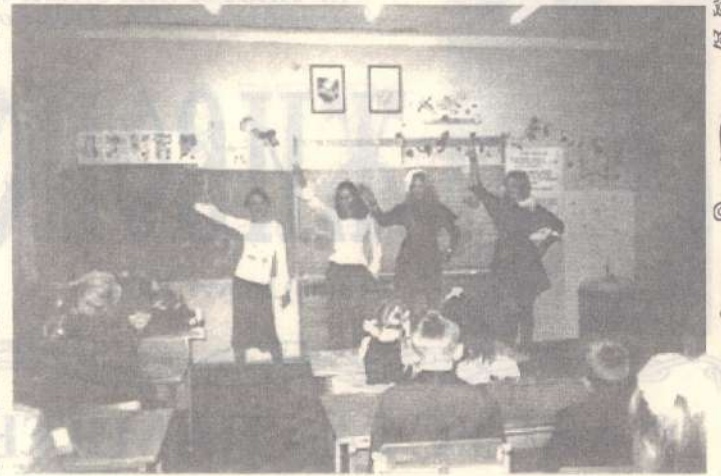
Фрагмент школьного праздника