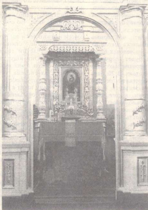
Престол Явленского храма

насельникам святой обители, кто в эти дни проявлял заботу о нас и оставил в наших душах светлую и тихую радость.