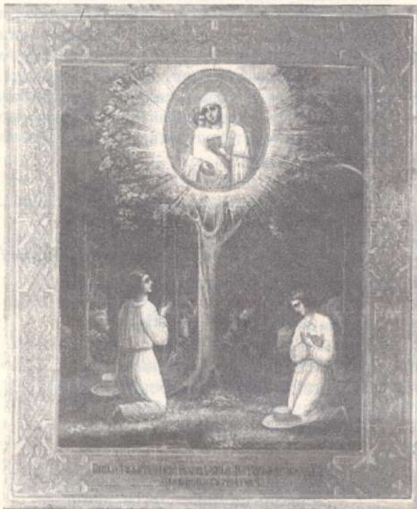
Жировицкая икона Божией Матери