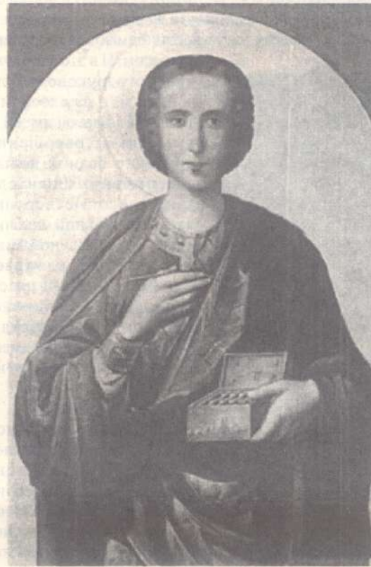
Святой великомученик и Целитель Пантелеимон

Многим, я думаю, памятни два летних дня 1997 года – 9 и 10 августа, праздники св. Пантелеимона и Смоленской иконы Божией Матери. Тогда из Предтеченского храма в строящийся мы прошли крестным ходом и молились в первый день на первом этаже в будущем Пантелеимоновском приделе, а на следующий день поднялись наверх – туда, где еще предстояло построить главный придел в честь Введения во храм Пресвятой Богородицы. Кто сам не участвовал, или по крайней мере не наблюдал изо дня в день, тот даже не может представить себе, сколько труда было вложено, чтобы привести в порядок, очистить, укрепить подвал и бетонный каркас, нижние и верхние перекрытия первого этажа, а затем и достроить недостающее и подготовить все к открытию Пантелеимоновского придела. В этот период нас нередко упрекали в том, что мы только говорим о стройке и собираем средства, а никакой работы не видно. Тем не менее люди не переставали поддерживать стройку своими пожертвованиями.