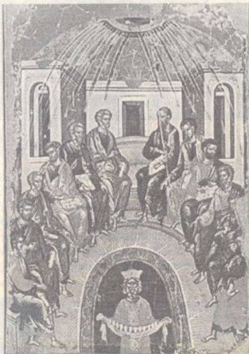
Сошествие Святого Духа на апостолов. Икона XV в. Патмос

Митрополита Хризостома хорошо знают висагинцы. Верующие горожане с большим энтузиазмом ждут встречи с ним. Его красноречивые проповеди всегда производят на них большое впечатление. Об отношении Владыки к Висагинасу мы попросили рассказать настоятеля общины святого великомученика и Целителя Пантелеимона протоиерея Иосифа.