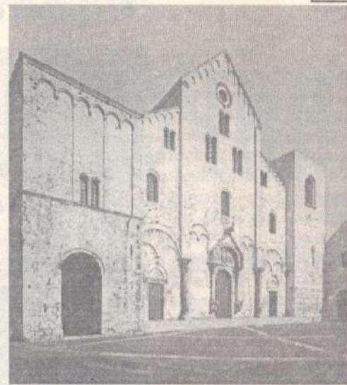
Базилика Святителя Николая в г.Бари

На гробнице с мощами Святителя настоятелем Подворья Русской Православной