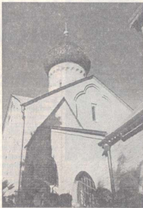
Храм-подворье Святителя Николая в г.Бари

В 1998 году, в связи с увеличившимся потоком православных паломников из России и других стран, главный храм комплекса Русской Церкви в Бари во имя Свт.Николая (верхний храм) и ряд помещений были переданы мэрией города Московскому Патриархату. С 1999 года в храме регулярно совершаются богослужения, при храме существует большая ошина верующих, ведется активная приходская работа. Совершаются также богослужения на мощах Святителя и Чудотворца Николая.