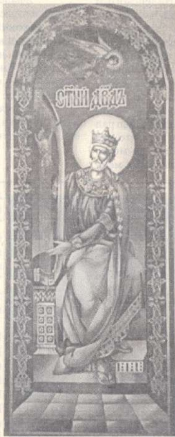
Св. пророк Давид