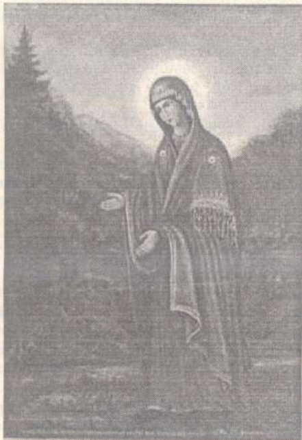
Пюхтицкая икона Божией Матери

Сто лет назад, когда была построена обитель, Божия Матерь, явившись одной инокине, пообещала каждую ночь навещать монастырь. "Все в монастыре делает Пречистая нашими руками. Мы