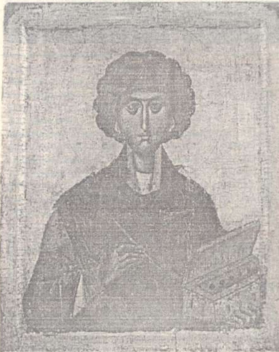
Св. вмч. Пантелеимон, конец XIII в. Афон Икона из Хиландарского монастыря.

Предтеченской общины, несмотря на каждодневные нужды и заботы, мысли многих из нас были обращены к будущему храму, который мы должны были построить. Никто нас к этому