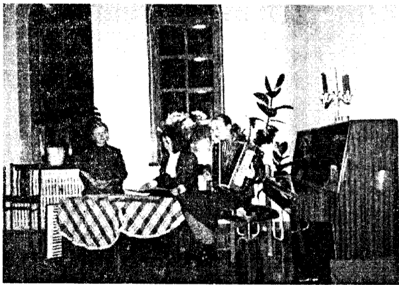
Первые приходские посиделки в новом помещении