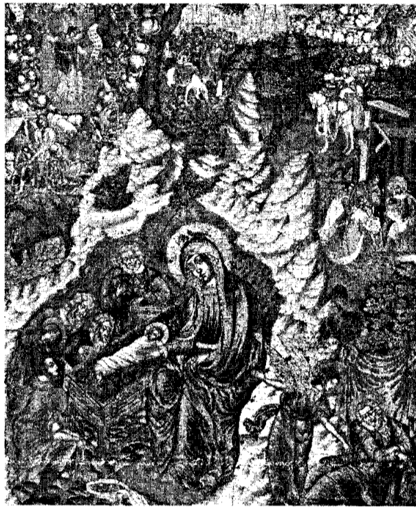
РОЖДЕСТВО ХРИСТОВО Икона конца XVII века

Возлюбленные! Эту радость о родившемся в вертепе, которую мы сегодня переживаем, эту благодарную любовь к нему понесем в мир, делись этой радостью с теми, кто еще не обрел Бога, не нашел дорогу к храму, с теми, кто устал и отчаялся в этом мире, заблудился на его опасных перепутьях. Будем творить дела милосердия и не смущаться, если силы наши невелики. И не оскудеет наша любовь, потому что никогда не иссякнет