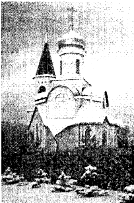
Храм Иверской иконы Божией Матери в Паланга

чь средства (а он вложил в это богоугодное дело 2 млн. литов), и был построен вновь освященный храм Иверской иконы Божией Матери в Паланге. Это деяние было совершено в память о его