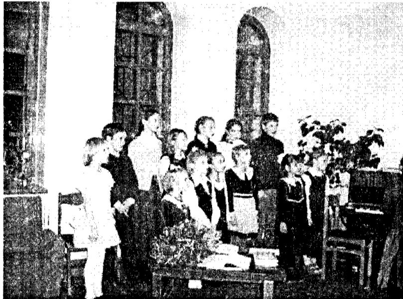
Выступление детского хора на вечере классической музыки