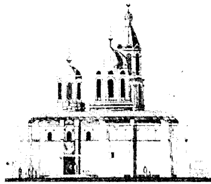
Проект будущего храма

Творческие коллективы Висагинаса и Вильнюса неоднократно были инициаторами благотворительных концертов, сборы от которых передавались на строительство храма.