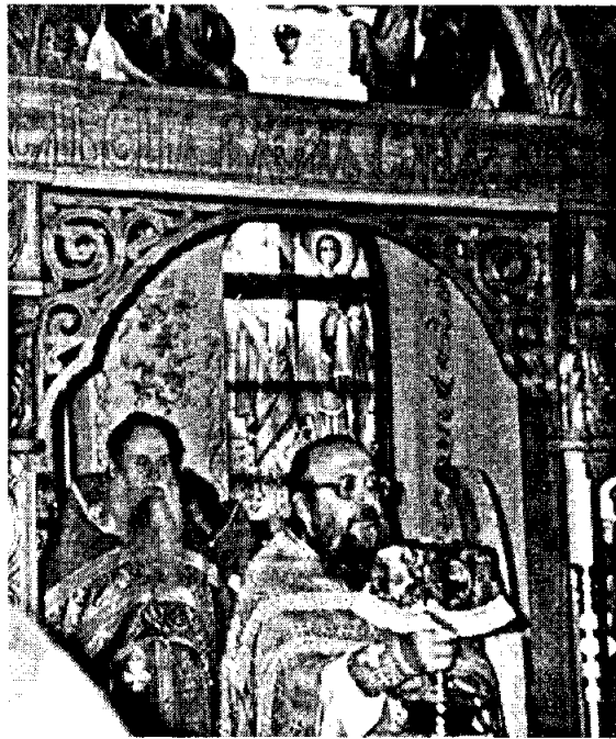
Божественная Литургия. Освящение престола

«Я хочу пожелать всем вам сохранить храм в своей душе и личным примером воодушевлять подрастающее поколение, – сказал Владыка, обращаясь к прихожанам, – и хотелось бы верить, что и здесь, в этом храме будет тешиться лампада православия, а значит, и в этом молодом городе, которому нынче исполнилось 25 лет».