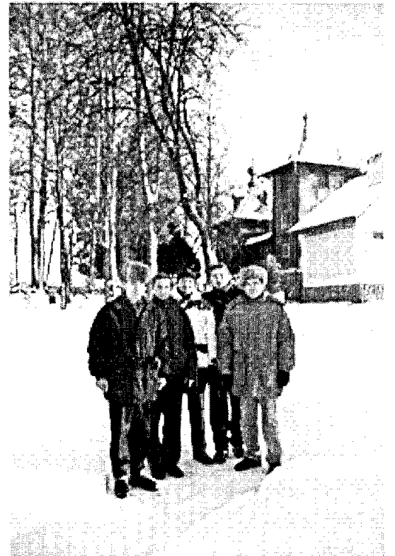
Наши братья в Михново

Не один год наши братья и сестры ездят в сельскохозяйственную православную общину Михново, которая находится недалеко от г.Вильнюса. Там они помогают в физическом труде, молятся, участвуют в богослужениях, приобщаются к истинной духовной жизни.