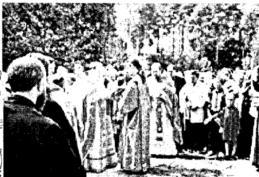
Крестный ход во время освящения храма

Освятил придел и совершил первую Божественную Литургию митрополит Виленский и Литовский Хризостом, приехавший по этому случаю в наш город. В службе принимали участие два хора: хор храма Рождества Иоанна Предтечи