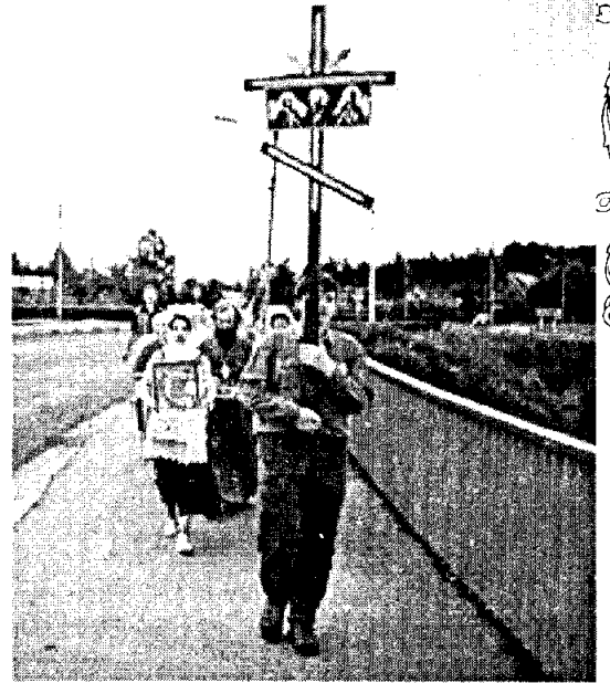
Паломничество в Вильнюс

Церковная жизнь висагинских православных общин не ограничена только лишь территорией нашего города и благочиния. Давно установились тесные контакты с православными общинами других городов. Не раз к нам в гости приезжали братья и сестры из Клайпеды, Швенчениса, Вильнюса, Каунаса... Также и наши прихожане всегда с большой радостью и усердием принимают участие в паломничествах, крестных ходах, устраиваемых епархией. Например, во время празднования 650-летия Виленских мучеников Антония, Иоанна и Евстафия и 400-летия основания Свято-Духова монастыря в 1997г. состоялось паломничество с крестным ходом по маршруту Висагинас – Вильнюс. Каждый год