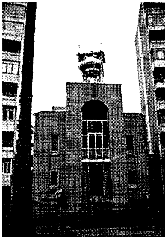
Вид храма Рождества Иоанна Предтечи