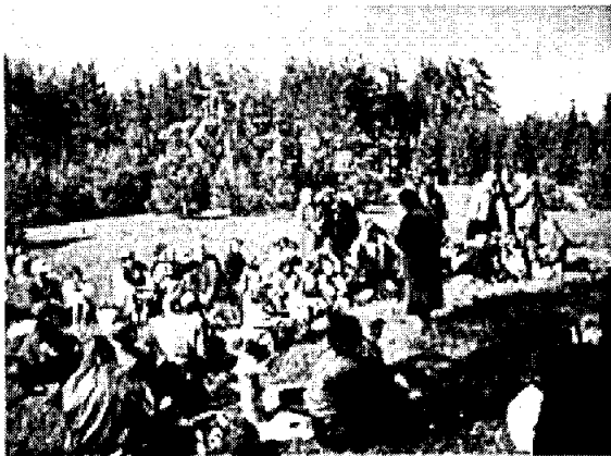
На лесной поляне