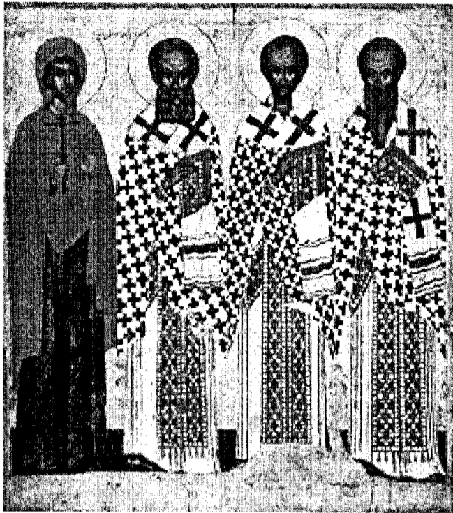
Избранные святые: Параскева Пятница, Григорий Богослов, Иоанн Златоуст, Василий Великий. XV в.

Некоторые христианские общества не признают святости отдельных людей, - веруют только в Иисуса Христа. Эта вера, как-будто и вправду, все может даровать человеку, заполнить все его существо. Почему же Сам Господь так устроил, что нас окружает множество людей, к которым мы можем обращаться с молитвой также, как и к Господу, к которым устремляются наши помыслы и чувства, как стремятся они к Самому Богу. Господь имеет в Себе весь свет, всю красоту, благодать, всю премудрость. Он мог бы просто ослепить нас Своим светом и ничего другого мы бы уже не видели и не желали бы видеть. Но мы видим, что не так устроил это Господь. Подумаем, почему? Во-первых, мы не в таком духовном состоянии, чтобы видеть это Солнце во всем Его блеске и сиянии. И, во-вторых, Само это Солнце по Своей милости и любви к Своим же созданиям желает, чтобы вокруг Него было целое созвездие светил, которым Он отдает Свой свет, красоту, премудрость, благодать. Такая благодать дается не только великим святым. Каждого из нас Господь просвещает Своим светом, милостью и любовью, чтобы мы тоже становились бы маленькими солнышками и светили бы ближним. В жизни так и бывает: если человек от всей души стремится к Господу, старается хранить свое сердце,