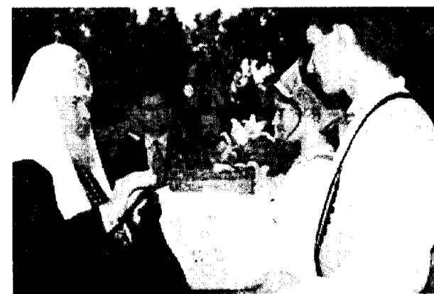
Встреча Святейшего в школе-интернате г.Новой Вильяны

Святейший Патриарх Московский и всея Руси Алексий II: