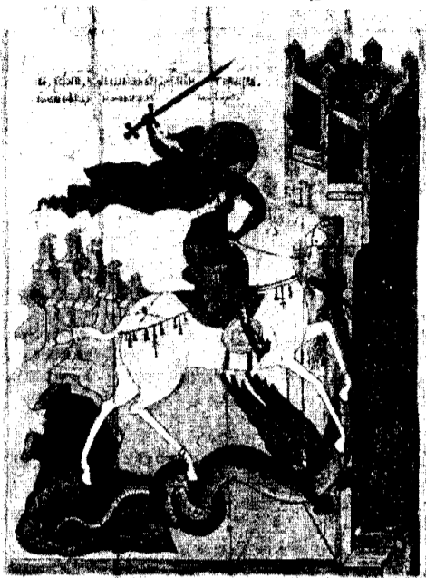
Икона конца XV века

6 мая - День памяти Великомученика Георгия Победоносца