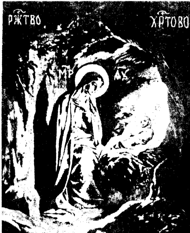
Ясли тихо светят взору, Озарен Марии лик...