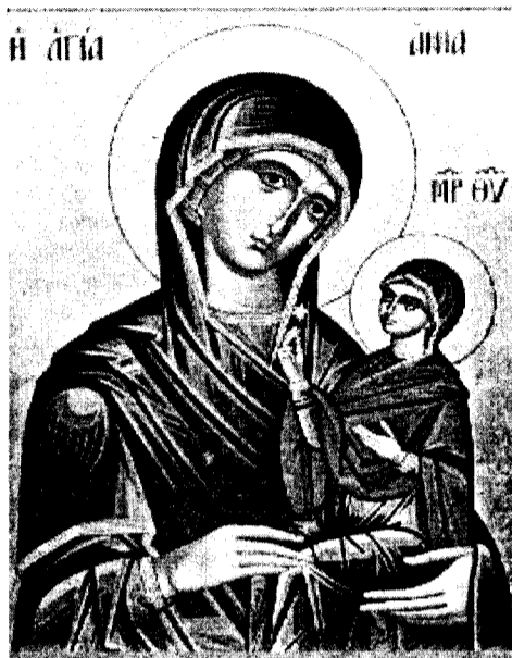
Икона праведной Анны с Пресвятой Богородицей на руках

Мы молимся Божией Матери, потому что Она ближе всех к Богу и вместе с тем близка также и нам. Ради