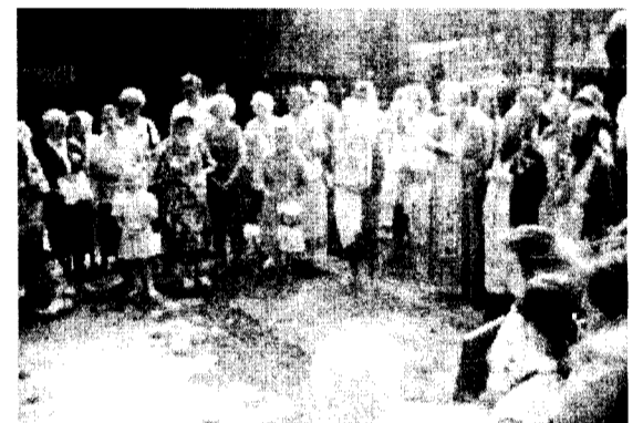
Во время молебна.

Православная община храма Рождества Иоанна Предтечи благодарит всех людей, жертвующих на строительство храма.