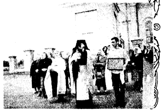
В Вевисе нас встретили по русскому обычаю хлебом-солью.

Переночевали мы в монастырских кельях. Между тем, в монастырь продолжали