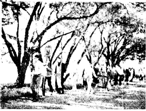
... на г. Вевис.