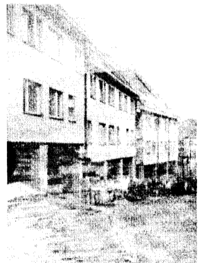
По улицам Вильнюса