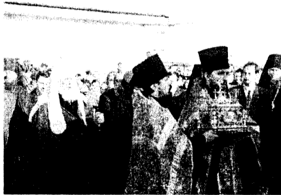
Встреча мощей в аэропорту в Москве.

(из Акафиста святому великомученику и целителю Пантелеимону).