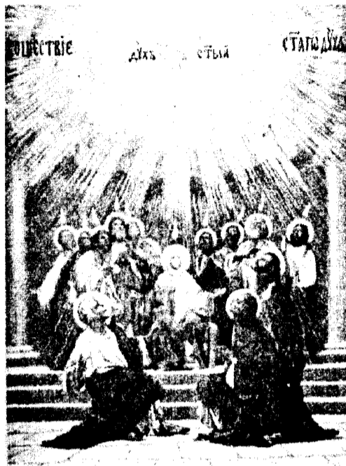
Сошествие Святого Духа на Апостолов в виде огненных языков.