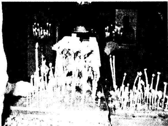
Души их во благих водворятся