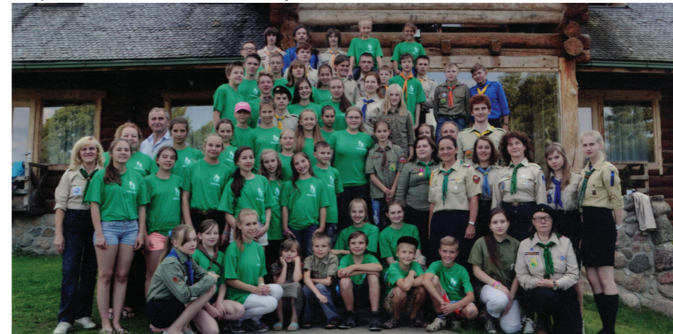
Литва 2013.

Но, это практические основы. А параллельно, ненавязчиво, детям даётся и духовная база, – Лариса снижает тон. – Утро и вечер – обязательно молитвенное правило. Все делается с именем Бога, с тем чтобы каждый ребенок впитал в себя истину – «Без Бога ни до порога». Знаете, как радостно слышать, когда ребенок, сделав что-то значимое, не бьёт себя в грудь: «Вот я какой – сам сумел!», а говорит: «Слава Богу, у меня это получилось!».