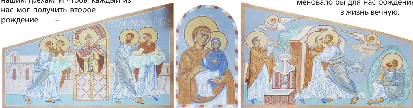
Фреска южной стены. Сюжет «Рождество Пресвятой Богородицы». Художник Алина Князева

В озблагодарим нашего Господа, возблагодарим Пресвятую Богородицу и её святых родителей Иоакима и Анну, за то, что благодаря их святой жизни, их подвигу, по промыслу Божию, мы получили эту возможность – рождения в жизнь вечную. Будем беречь её, несмотря на наши немощи, наши недостатки. Будем стараться, чтобы Рождество Богородицы и Рождество Христово не стали для нас просто преходящими праздниками, как, к сожалению, для многих людей. Весь мир празднует Рождество Христово. А живет ли после этого праведно? Будем стараться, чтобы Рождество Пресвятой Богородицы знаменовало бы для нас рождение в жизнь вечную.