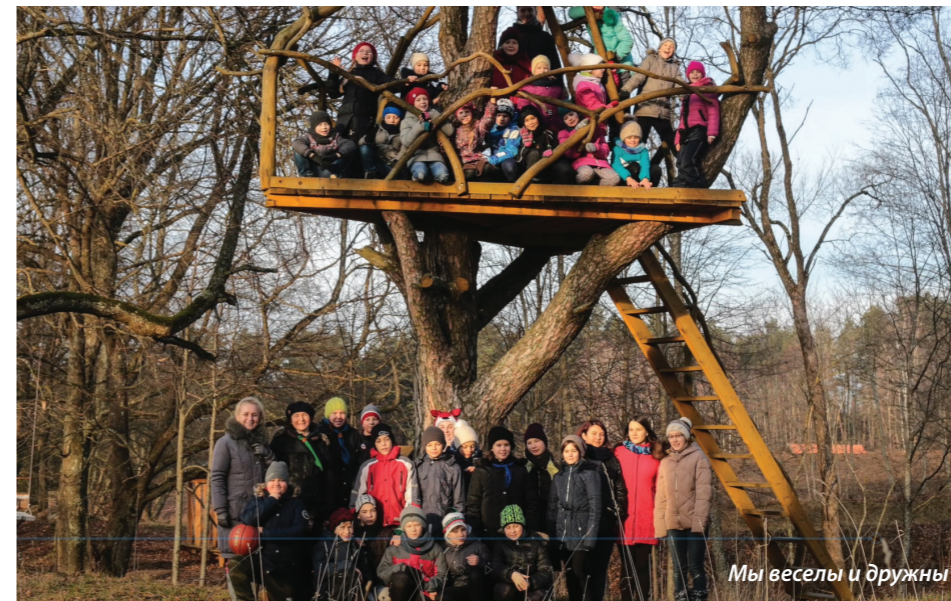
Мы веселы и дружны

– Кроме летних лагерей, в течение года вы ведете какую-то деятельность?