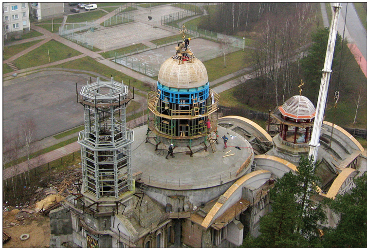
2006 год. Водружение крестов на купола строящегося храма

Господь «открыл нам финансирование», как я говорю, «кредитную линию».