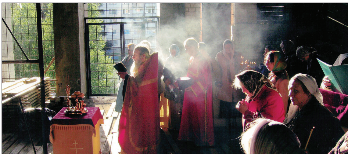
Первая всенощная в верхнем приделе Введенского храма в праздник Почаевской иконы Божией Матери.

Служба информации Введено-Пантелеимоновского прихода Фото из архива прихода